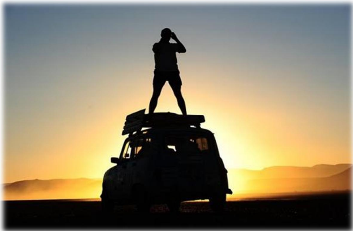
Coucher de soleil dans le désert

L'association Solid'R4 Maroc a pour but d'organiser la participation annuelle de notre école ECAM Strasbourg-Europe au 4L Trophy. Elle participera avec une voiture au 4L Trophy 2014. Les connaissances que nous avons acquises et les expériences que nous vivons, nous permettent de développer un projet à l'envergure de notre volonté et de le mener à bien.