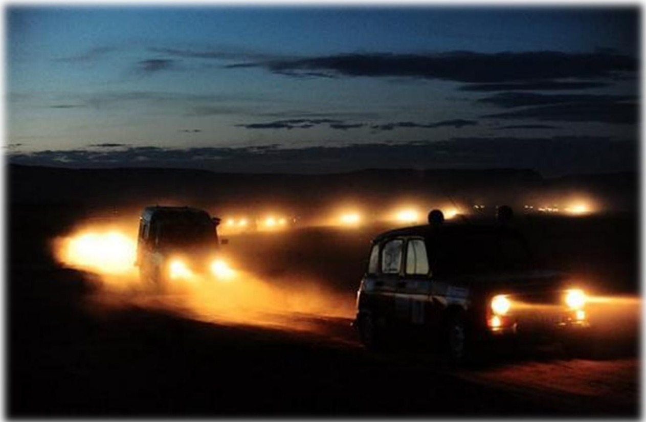
Raid de nuit

Ce projet humanitaire contribuera au développement de la scolarisation au Maroc. L'aventure 4L Trophy représente pour nous un moyen de concilier l'aspect sportif avec la solidarité et l'entraide, ce qui est pour nous, futurs ingénieurs, une forme de plaisir responsable. Nous voyons, dans la société de demain, un accès toujours plus grand à l'éducation pour les plus démunis. C'est dans cette optique que nous adhérons aux valeurs et aux principes du 4L Trophy, pour que des enfants puissent avoir une chance, tout comme nous, de se faire une place dans la société de demain.