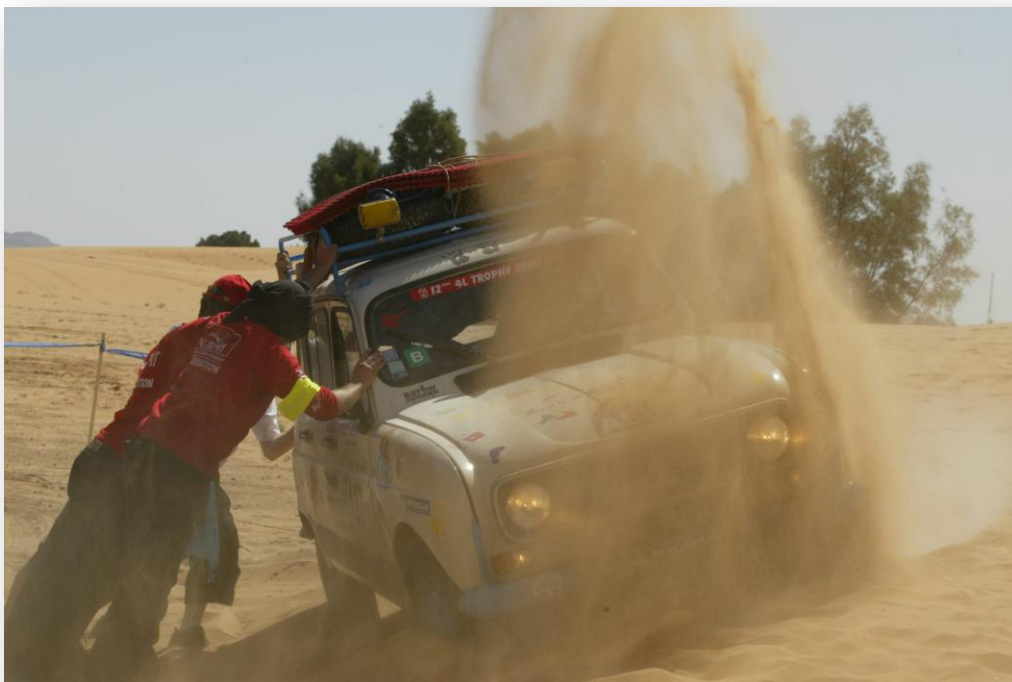
Une 4L ensablée sur une dune.

Plus qu'une course: une découverte, une aventure basée sur le respect des Hommes et de l'environnement !