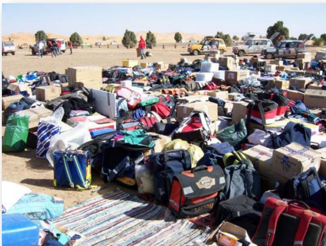
Une partie de l'aide humanitaire

UN RAID ? OUI, MAIS UN RAID HUMANITAIRE.