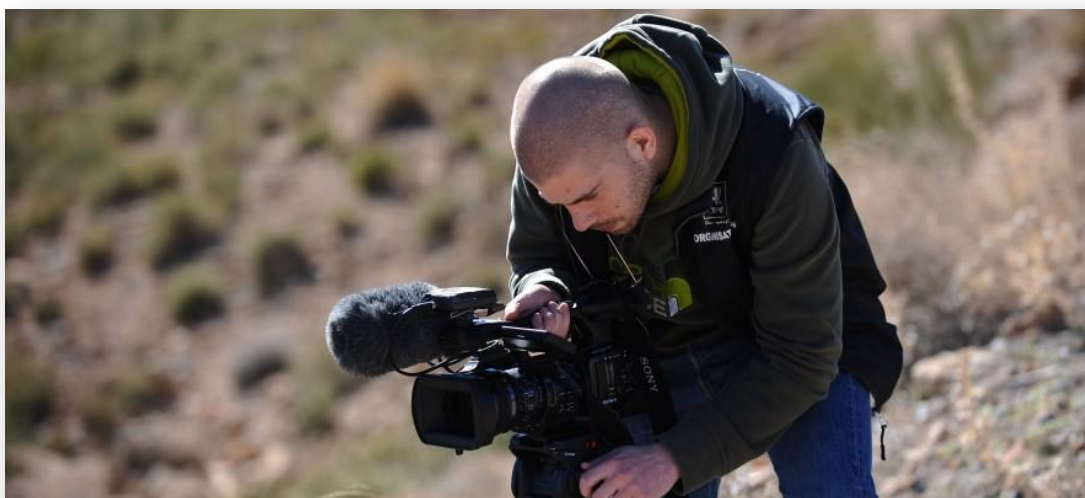
Couverture médiatique du Raid : cameraman